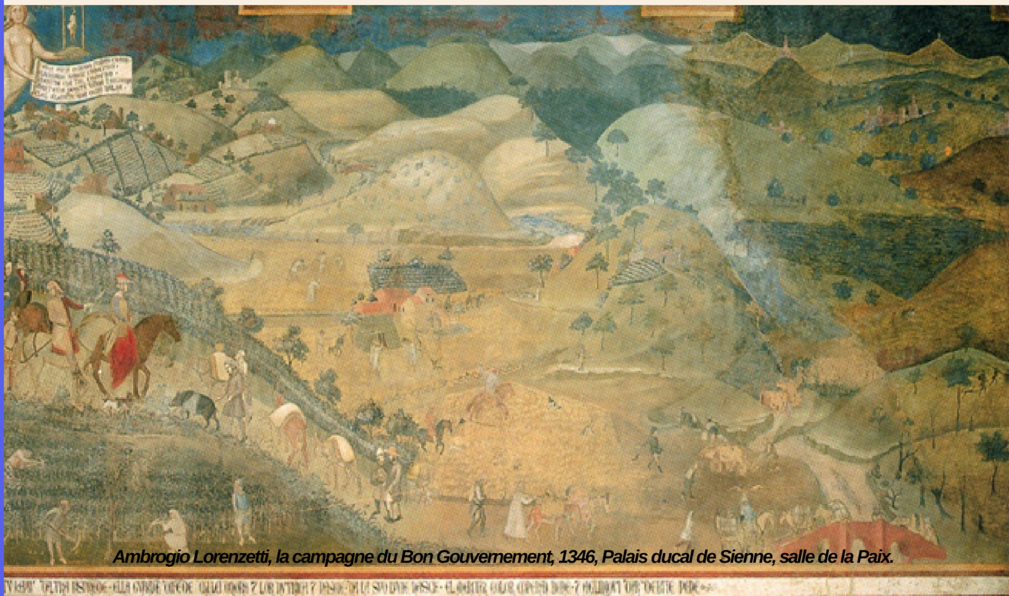
Ambrogio Lorenzetti, la campagne du Bon Gouvernement, 1346, Palais ducal de Sienne, salle de la Paix.